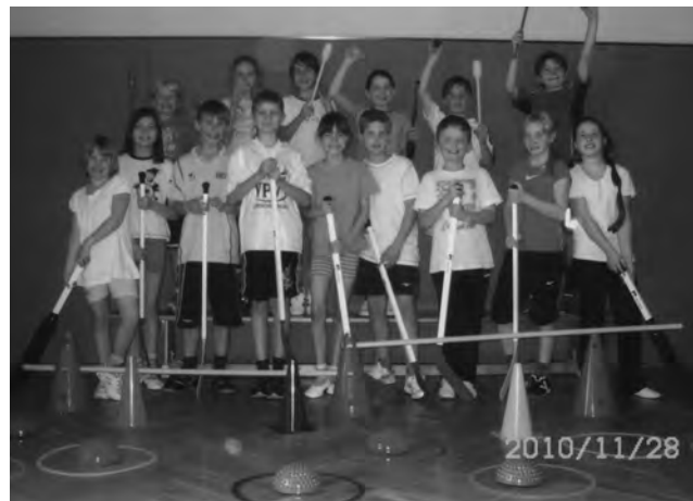
Die Lehrer und Schüler der Grundschule Frießnitz

Es ist schön, dass immer wieder Firmen und andere Einrichtungen bereit sind, mit unserer Schule in Frießnitz zusammenzuarbeiten. Dafür möchten wir Danke sagen !!!