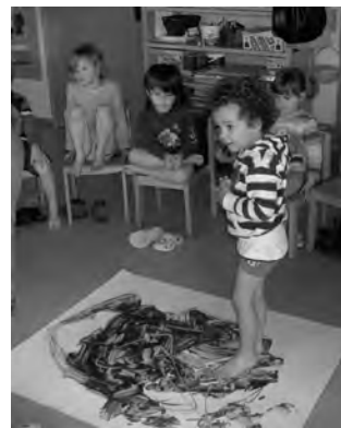
Malen mit den Füßen