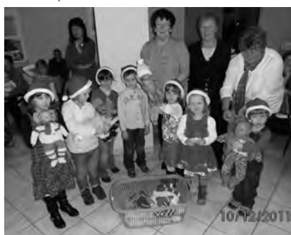
Puppensachen von den Strickfrauen

Zur Rentnerweihnachtsfeier in Burkersdorf überreichten die Strickfrauen unseren Kindern selbst gestrickte Puppensachen, über die wir uns riesig gefreut haben.