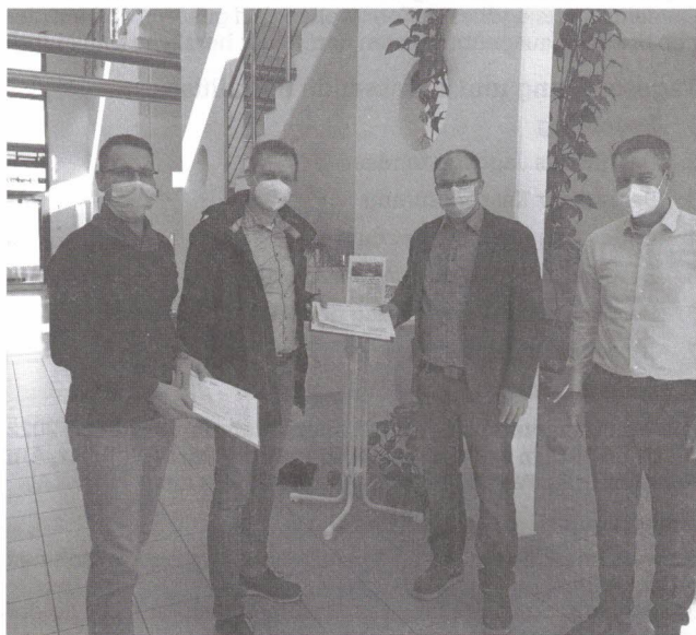
Der Geschäftsführer und Ausbildungsleiter der PI-Ceramic bei der Übergabe der Unterschriftenliste an zwei Petitionsvertreter.