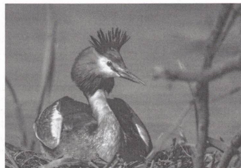
Haubentaucher (Podiceps cristatus)

Um eine Spende zur Deckung der Unkosten wird gebeten.