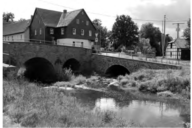
Die Auma-Brücke in Rohna, das Feuerwehrhaus im Bild ganz rechts

Und für Auswärtige, die unser verstecktes Dorf noch niemals bewusst zur Kenntnis genommen haben: Wir liegen in einem wiesenreichen, tief eingeschnittenen Tal an der idyllischen Straße zwischen Weida und Niederpöllnitz.