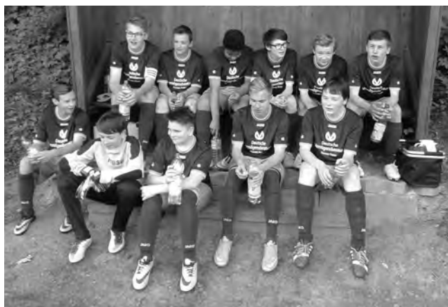
Die C-Junioren 14/15