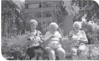
Wohnpark „Z25 WOHNEN + “