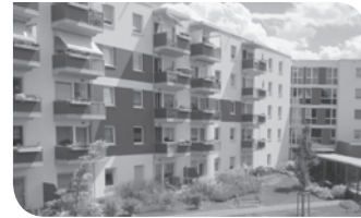
Wohnpark „ZUR ALTEN SCHULE II“