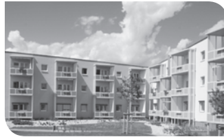
Wohnpark „ZUR ALTEN SCHULE I“