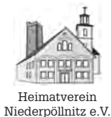
Heimatverein Niederpöllnitz e.V.

Für die Verpflegung ist mit Kaffee, Kuchen und Getränken gesorgt und für die Kleinen haben wir eine Bastelstation.