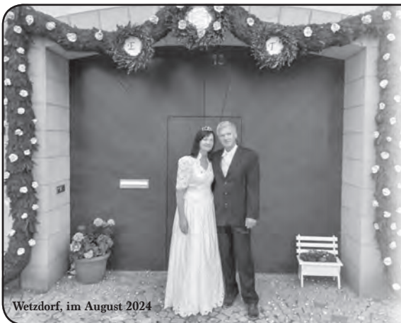
Wetzdorf, im August 2024

Das nächste Amtsblatt erscheint am 28.09.2024. Redaktionsschluss für Ihre Beiträge ist der 18.09.2024.