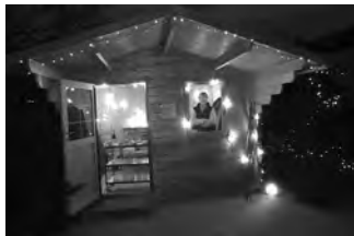
Das Team der Kita „Abenteuerland“

Ein herzliches Dankeschön noch einmal an alle Eltern für die Unterstützung.