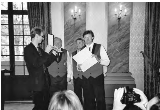
Foto aus dem Archiv des Männerchores: Übergabe Zelter-Medaille 2008

Das Jahr 2008 bedeutete nicht nur 130 Jahre Männerchor, sondern auch die Auszeichnung mit der Zelter-Medaille durch den Bundespräsidenten. Carl Friedrich Zelter (1758 – 1832), ein Zeitgenosse und Freund Goethes, wirkte als Musiker, Komponist und Dirigent und gründete bereits 1809 die erste Berliner Liedertafel. Sein Andenken wird dadurch in Ehren gehalten, dass eine nach ihm benannte Medaille an Chöre vergeben wird, die auf eine mehr als 100-jährige ununterbrochene Tradition zurückblicken können. Am 5. April 2008 überreichte der Herr Staatssekretär im Barocksaal der Staatskanzlei Erfurt Urkunde und Medaille.