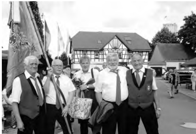
Freundschaft mit dem Männergesangsverein Schwend

Und dann schrieb die Zeitgeschichte ein neues Kapitel. Im April 1989 erfolgte eine Einladung des Männergesangsvereins Schwend aus der Oberpfalz zu deren 75-jährigen Gründungsfest. Unser Antrag zu einer Gastspielreise nach Bayern wurde naturgemäß mit sozialistischem Gruß kategorisch abgelehnt. Die friedliche Revolution in der damaligen DDR brachte es mit sich, dass die Niederpöllnitzer Sänger nebst Ehefrauen den 2. und 3. März 1990 in Schwend zu Gast waren. In der Erinnerung verbinden sich hier unvergessene und bewegende Augenblicke mit dem Beginn einer Sängerefreundschaft, die auch die Jahre überdauert hat. Die Begegnung mit den Sängern und ihren Familien, die vielen Gespräche und das gemeinsame Singen bedeuten uns noch heute erlebte und gelebte Wiedervereinigung im besten Sinne.